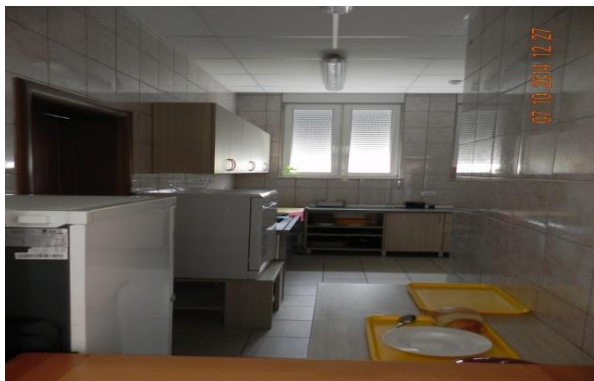
Slika broj 5