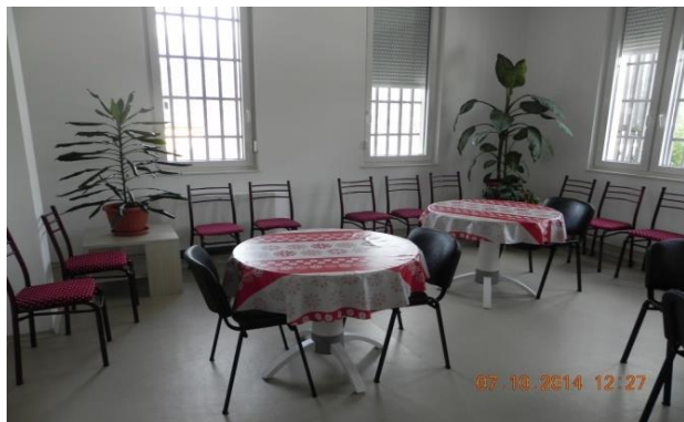
Slika broj 4

Zatečena lica u Prihvatištu, iskazala su zadovoljstvo količinom i kvalitetom obroka.